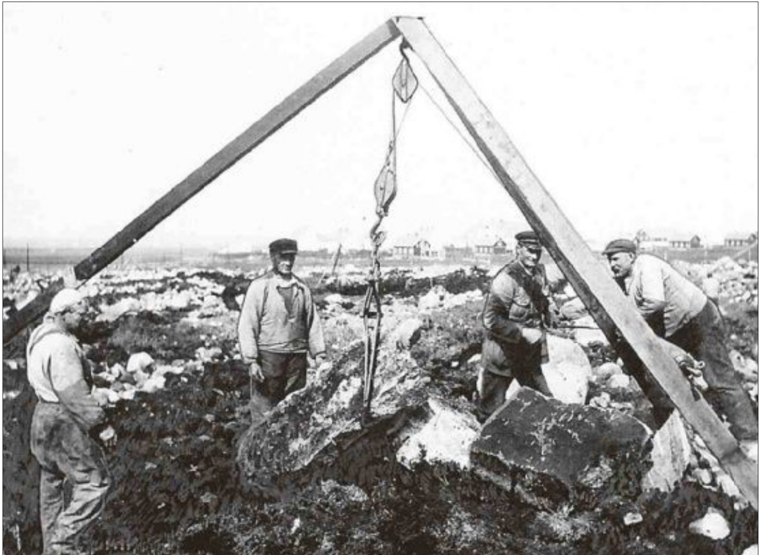
ARBEID: Nybrottsarbeidet foregikk med bruk av enkle mekaniske hjelpemidler som denne steinbukken. Her er en arbeidsformann i tett samarbeid med tre tvangsarbeidere. Foto fra Åna, sørvest for anstalten, som ses i bakgrunnen.